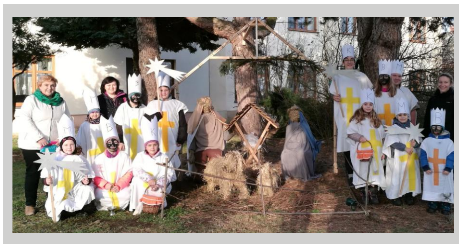
Roudnické tříkrálové koledování

Tříkrálová koleda má dlouhou tradici. Původně ji vykonával kantor se svými žáky, později kněz s ministranty. Přišli do domu, modlili se a zpívali, vykuřovali kadidlem a kropili svěcenou vodou, kterou den předem spolu s křídou posvětili. Na dveře nebo silný dřevěný rám nad nimi napsali písmena K+M+B a letopočet. Tato obchůzka měla slavnostní ráz a jejím smyslem bylo požehnání všem navštíveným domům i lidem, kteří v nich bydleli a uchránit je tak od neštěstí, nemocí a podobných nepříjemností. Děti se jako koledníci začaly na venkově objevovat o něco později, nakonec to byly převážně děti z nejhudších rodin. Jejich masky byly jednoduché a tvořily je většinou dlouhé bílé košile přepásané provazem, červeným šátkem nebo šerpou. Na hlavách měly papírové koruny zdobené malůvkami a zlatým nebo stříbrným papírem, vousy z koudele nebo vaty. I v současnosti vycházejí koledníci na Tříkrálové koledování.